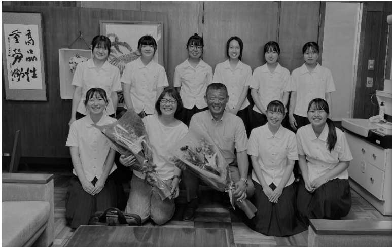
7月20日静岡県立磐田農業高等学校 農業クラブ役員さんと共に

40年前に卒業した母校の後輩たちから講演の依頼がありました。農園の話をするだけでいいと思っていいですよと気軽にお返事したら講演のテーマを聞いてびっくり。